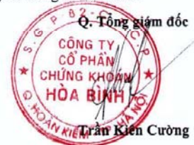
Trần Kiên Cường